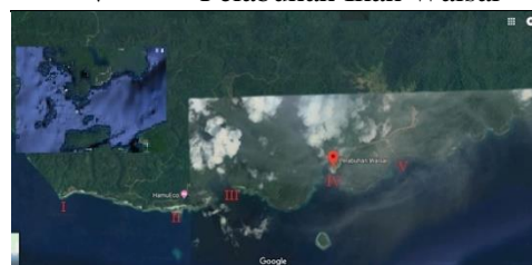
Gambar 1. Peta Lokasi Sampling