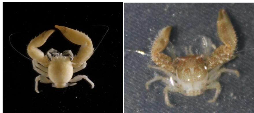
Gambar 3. Morofologi Pisidia sp.

Sampel Jenis Pisidia sp. yang ditemukan di pulau tunda secara morfologi hampir mirip dengan dengan specimen jenis Pisidia serratifons terutama yang ditemukan di Pulau Tikus, Pulau Pari (Anggraeni dkk., 2015). Namun bila dibandingkan dengan spesiemen yang ditemukan di Taiwan (Osawa dan Chan, 2010) sedikit berbeda, di mana pada bagian lengan Pisidia serratifons tidak terlalu bergerigi di bandingkan dengan jenis Pisidia sp yang terlihat jelas.