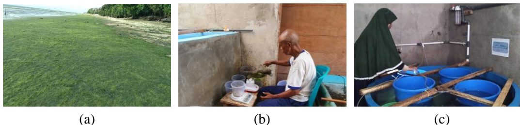
Gambar 1. Pemeliharaan Juvenil. (a) Ketersediaan Ulva sp. di alam; (b) Proses pembuatan ekstrak; dan (c) pemeliharaan juvenil

Pemberian pakan (Ekstrak Ulva sp. dan Sargassum sp. ) dilakukan setiap hari setelah pergantian air. Setiap hari dilakukan pula pergantian air pada wadah pemeliharaan sebanyak 70-100%. Selain itu, dilakukan penyiponan dua hari sekali guna pembersihan feses teripang pasir yang berada di dasar bak. Sampling pertumbuhan dilakukan pada setiap minggu selama penelitian berlangsung. Sampling pertumbuhann dilakukan dengan mengukur panjang tubuh juvenil sebanyak 12 ekor (30 % dari populasi) pada masing-masing wadah pemeliharaan. Bersamaan dengan pelaksanaan sampling pertumbuhan, dilakukan pula perhitungan mortalitas juvenil. Selama pemeliharaan berlangsung dilakukan pengukuran kualitas air (suhu, salinitas dan pH) seminggu sekali.