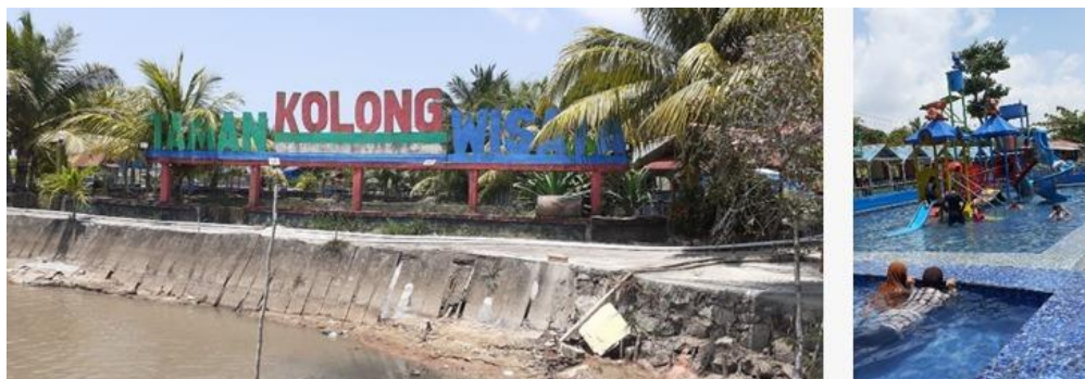
Gambar 11. Kolam Renang Taman Kolong Wisata Pangkalpinang