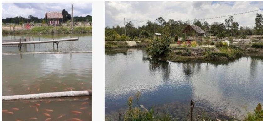
Gambar 6. Kolam ikan nila Belitung Timur