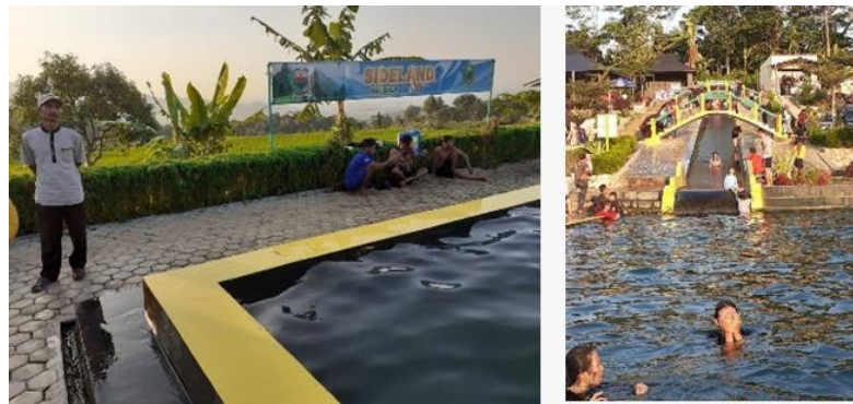
Gambar 8. Sideland Kaduella Kuningan