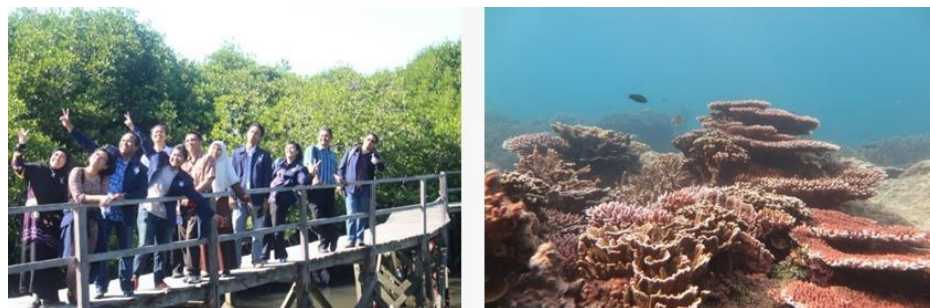
Gambar 10. Wisata mangrove dan terumbu karang di Pulau Kecil