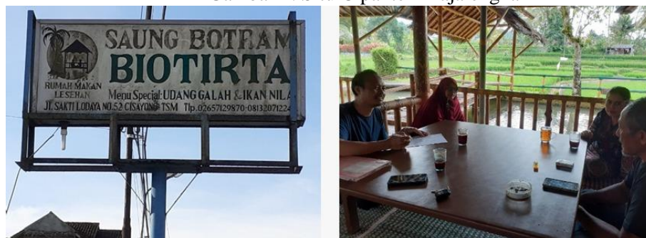
Gambar 3. Rumah makan Biotirta Tasikmalaya