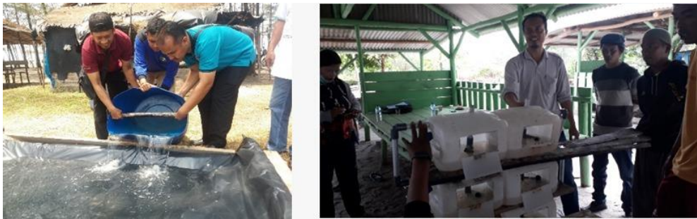
Gambar 1. Atraksi wisata pembuatan garam dan apartemen kepinging Bangka

konservasi, serta meningkatkan kesejahteraan masyarakat lokal melalui partisipasi mereka dalam industri pariwisata. Pengelolaan yang baik dan regulasi yang tepat harus diterapkan untuk menjaga kelestarian sumber daya perairan, mencegah kerusakan lingkungan, dan memastikan manfaat jangka panjang bagi destinasi dan masyarakat setempat. Potensi atraksi wisata berbasis sumberdaya perairan secara berkelanjutan dapat dikaji dan diperkenalkan kepada wisatawan mulai dari atraksi yang sudah umum maupun atraksi baru. Berbagai atraksi ini menjadi sumber pendapatan bagi pengelola destinasi pariwisata.