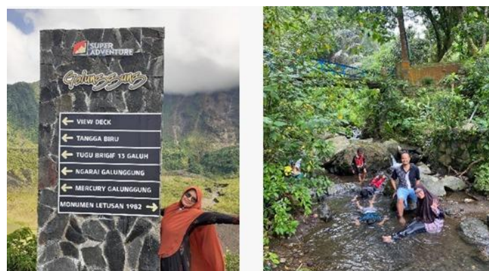
Gambar 9. Wisata air panas Galunggung Tasikmalaya