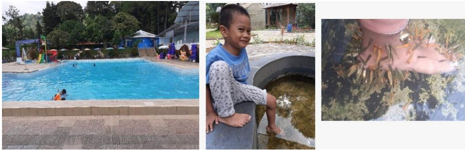
Gambar 4. Kolam renang dan terapi ikan di Hambalang Bogor