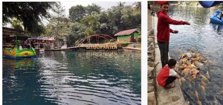
Gambar 2. Situ Cipanten Majalengka