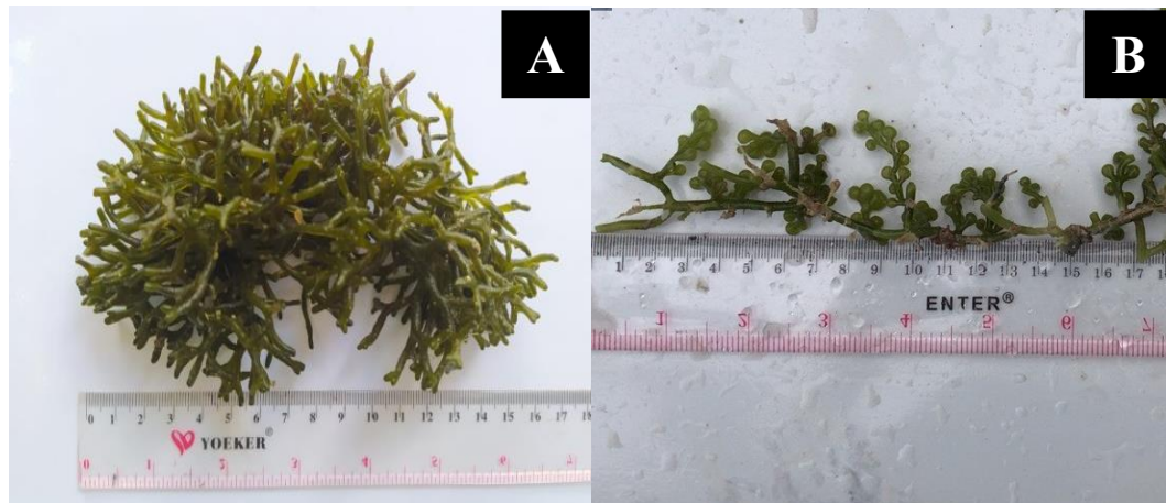
Gambar 3. Rumput laut hijau, (a) Codium sp., (b) Caulerpa microphysa